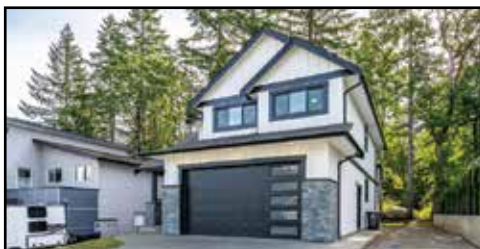
4-2880 ARDEN RD., COURTENAY

YOUR DREAM HOME AWAITS in this stunning 1927 sqft residence, backing onto peaceful green space. The bright open concept main floor features vaulted ceilings in the living room and large windows. The kitchen offers quartz countertops, quality cabinetry and a spacious island. Upstairs you will find three generous bedrooms!