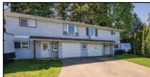
B-4657 VALECOURT CRES, COURTENAY

WELCOME TO THIS 3 BEDROOM, 2 bathroom half duplex home offering 1,471 sqft of comfortable living space with a functional ground level entry design. Upstairs features a bright and inviting kitchen, dining and living areas, creating a warm and open atmosphere. Two bedrooms are located on the main floor.