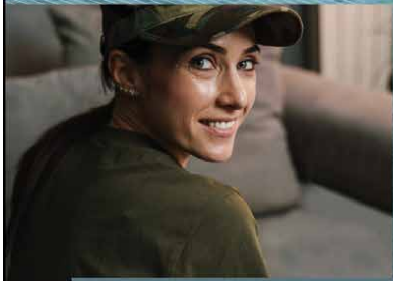
Georgia Strait Women's Clinic is Canada's only trauma program exclusively serving women