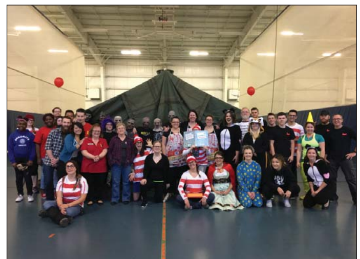
Photo : Des bénévoles ont mis la main à la pâte lors de la fête de l'Halloween des PSP, en 2017.

80 bénévoles réguliers ont participé à notre soirée d'appréciation des bénévoles, tenue le 10 mars 2017.