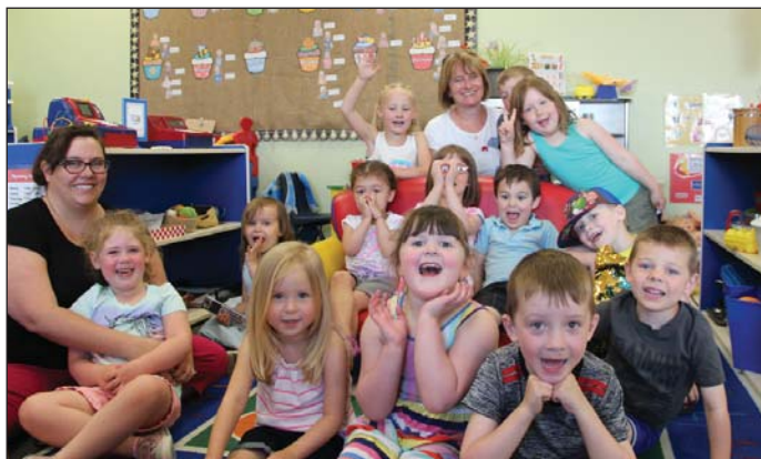
Photo : Prématernelle, groupe de l'avant-midi 2017-2018