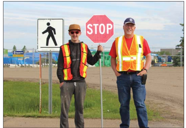
Photo : Des bénévoles détournent le trafic lors de la course Loops for the Troops, en 2017.

Le CRFM a offert des services d'orientation et de la formation pour 5 bénévoles-parrains sélectionnés. Ces derniers ont tissé des liens avec 5 familles, par l'intermédiaire du programme d'accueil de l'Aviation.