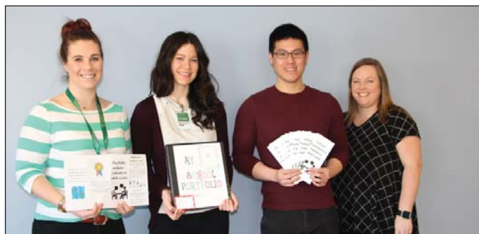
Photo : Les étudiants en soins infirmiers de l'université de l'Alberta ont développé une brochure pour les familles militaires. Après avoir rencontré des membres du personnel du CRFM et des familles militaires, ils ont créé cet outil comportant des conseils sur la création d'un portfolio scolaire. Ce dernier consiste en la mise en commun de l'historique scolaire de chaque enfant, y compris ses réalisations et accomplissements personnels.

Le CRFM d'Edmonton a reçu des étudiants des programmes de travail social et d'éducation de l'université MacEwan, ainsi que des étudiants des programmes de soins infirmiers et d'écologie humaine de l'université de l'Alberta.