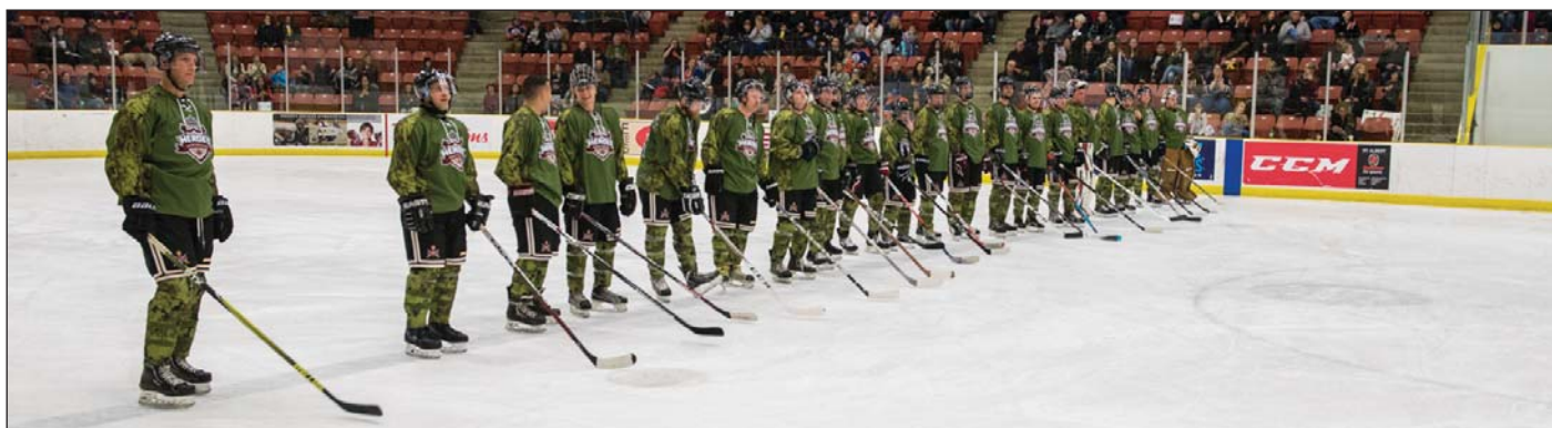
Partie de hockey du Heroes Hockey Challenge, édition 2017