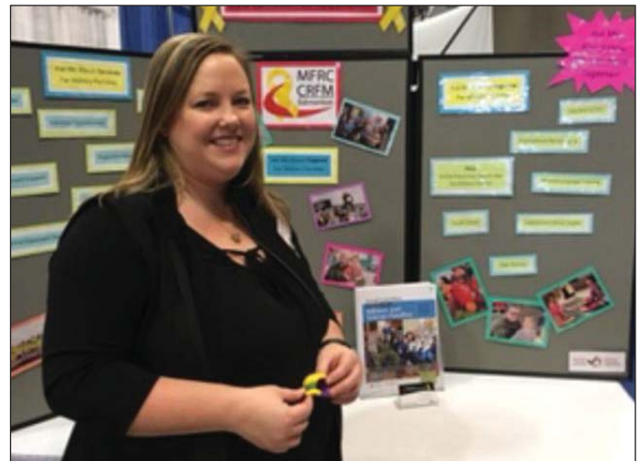
Photo : La coordonnatrice de liaison avec les écoles devant le kiosque du CRFM lors du congrès des enseignants North Central Teachers' Convention .

493 personnes ont participé à notre Foire automnale et à notre pique-nique communautaire annuel