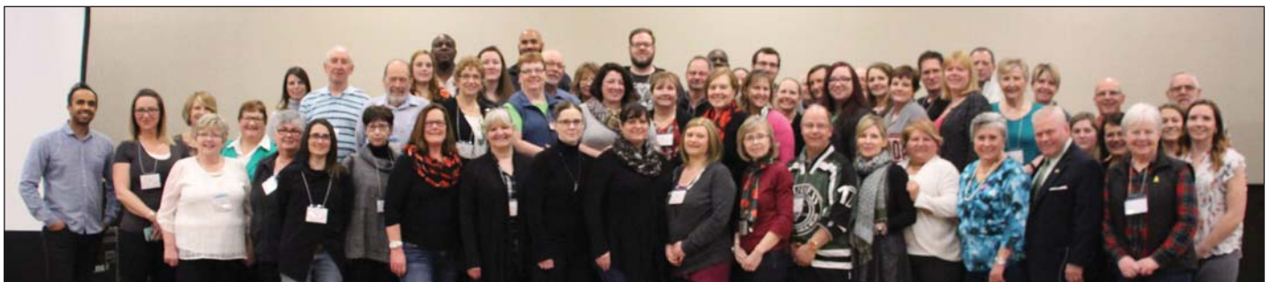
Photo : Participants, organisateurs et conférenciers lors de la série de conférences « Force et guérison »