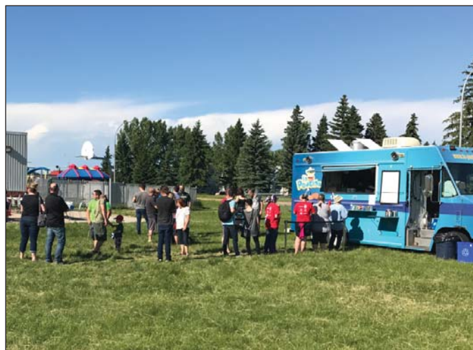
Photo : Fête de la Saint-Jean-Baptiste au CRFM, en juin 2017

Pour la nouvelle année, les services linguistiques prennent un nouveau départ avec la mise en place d'un projet pilote d'apprentissage de l'anglais comme langue seconde, ainsi que plusieurs nouveaux programmes comme un club de marche, une visite du quartier francophone d'Edmonton, des brunchs-conférences, divers ateliers et des activités amusantes pour les petits et les grands.