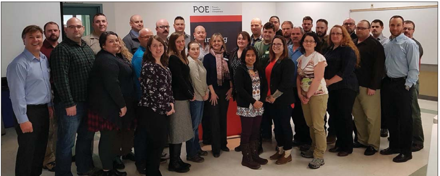
Photo : participants à l'atelier offert dans le cadre du programme Prince's Operation Entrepreneur

6 personnes ont assisté à l'atelier Militaire 101