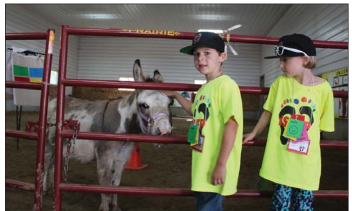
Photo : Participants à l'édition estivale du programme iSTEP, en visite au centre de psychothérapie Dreamcatcher Nature-Assisted Therapy Association.

Une autre difficulté est de s'assurer qu'un soutien soit disponible à tous les membres de la famille, lorsqu'un d'entre eux doit faire face à un problème de santé mentale. Il est important de reconnaître que l'impact global découlant d'un problème vécu par un seul membre de la famille touchera également tous les autres, surtout les enfants.