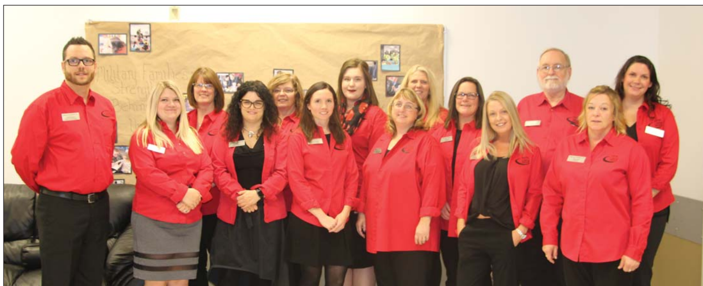
Photo : Personnel du CRFM pendant l'activité de reconnaissance des donateurs, en 2017