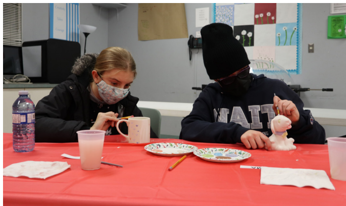
Faire des rencontres par la créativité lors de la soirée peinture pour les jeunes