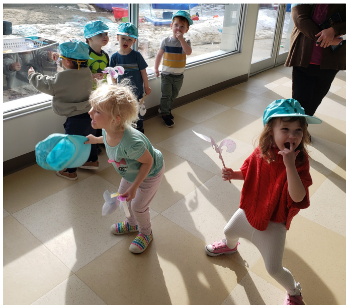
Défilé de la garderie lors du mois de la Francophonie