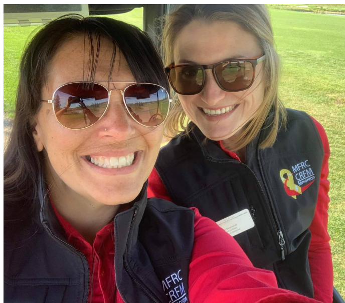
Tournoi de golf caritatif des célébrités 2021

Tous les efforts ont été faits afin d'assurer que tous les commanditaires et donateurs qui ont contribué à cet exercice financier soient reconnus. Si des erreurs ou des omissions se sont produites, veuillez communiquer avec le département de développement des fonds du CRFM au (780) 973-4011, poste 2285.