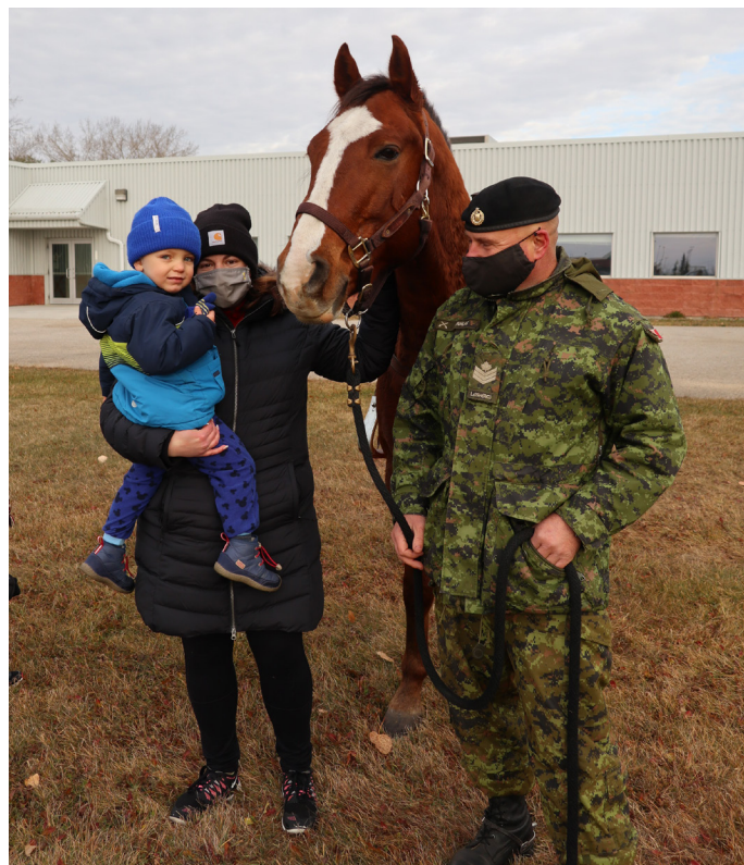
Visite à la garderie du Régiment de Lord Strathcona's Horse (Royal Canadians) (LDSH(RC))