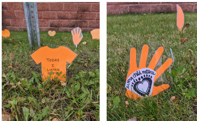
Reconnaissance de la Journée nationale de la vérité et la réconciliation

Depuis plus de 30 ans, le CRFM s'est engagé à soutenir les familles des militaires qui doivent relever ces défis uniques au moyen de programmes et de services qui contribuent à augmenter la force et la résilience des familles des militaires.