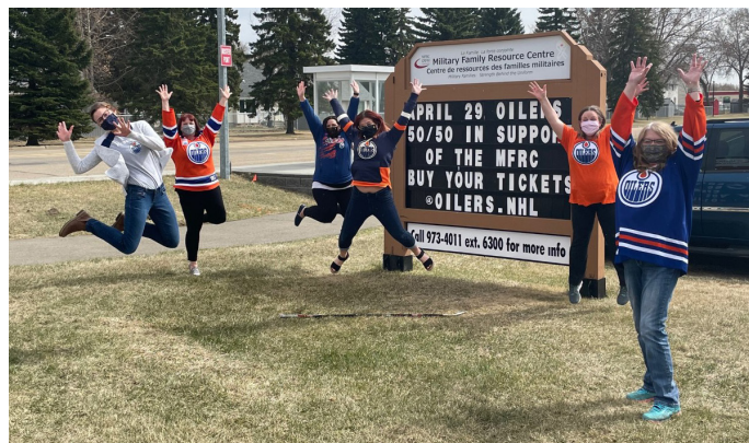
Soirée de reconnaissance des militaires du Edmonton Community Foundation, 2021