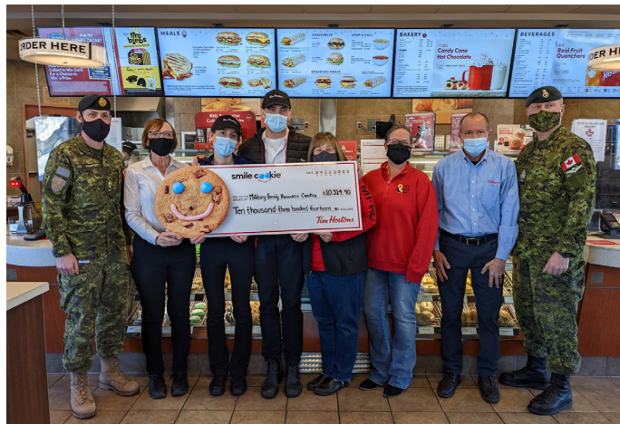
Remise du chèque pour la semaine du Biscuit sourire de Tim Hortons