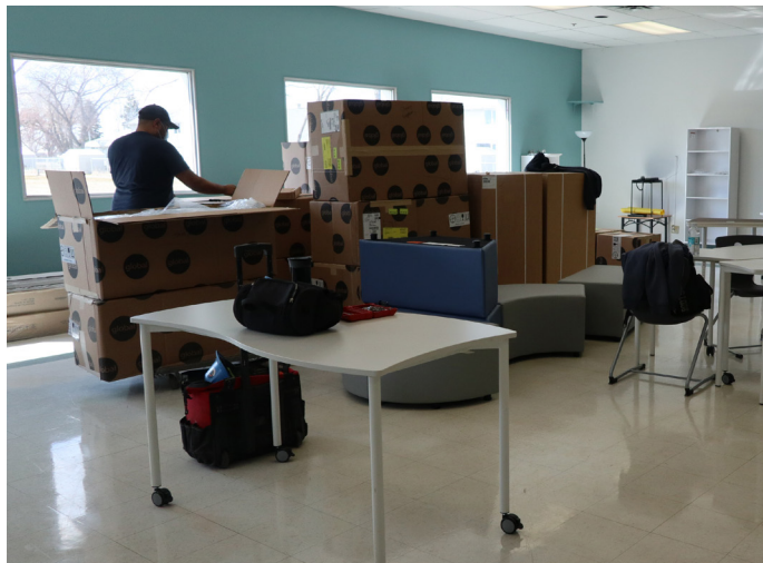
Livraison de peinture fraîche et nouveaux meubles pour le centre de la jeunesse

Cette année, les rénovations du centre de la jeunesse ont débuté et nous avons commencé à nous préparer à offrir un tout nouvel espace pour que les jeunes puissent s'amuser!