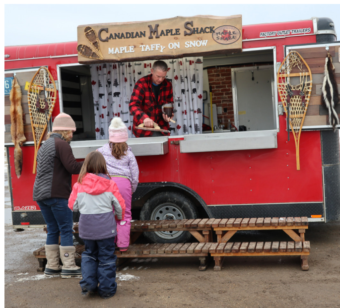
Cabane à sucre pour célébrer le mois de la Francophonie