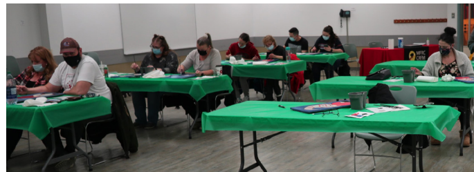
Soirée peinture pour adultes, 2021

Des familles militaires fortes sont le fondement des Forces armées canadiennes.