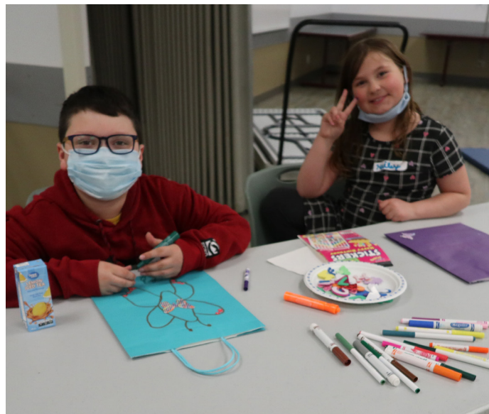
Camp d'entraînement aux techniques d'adaptation