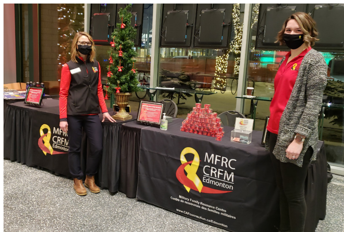
Vente d'ornements pour la levée de fonds lors du concert des Fêtes de la fanfare de l'ARC.