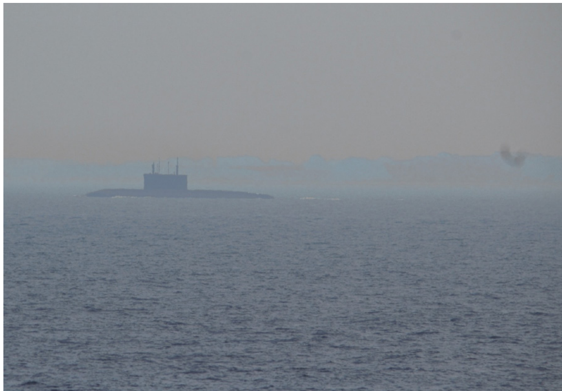
Un sous-marin russe est surveillé par l'équipage du NCSM Shawinigan , alors qu'il traverse la mer Baltique, le 29 août.

Le droit de passage inoffensif prévoit des normes et des attentes que les navires doivent respecter lorsqu'ils traversent les eaux d'un autre pays. Au cours de ces activités de surveillance, les navires russes ont été observés à respecter ces normes et ces attentes.