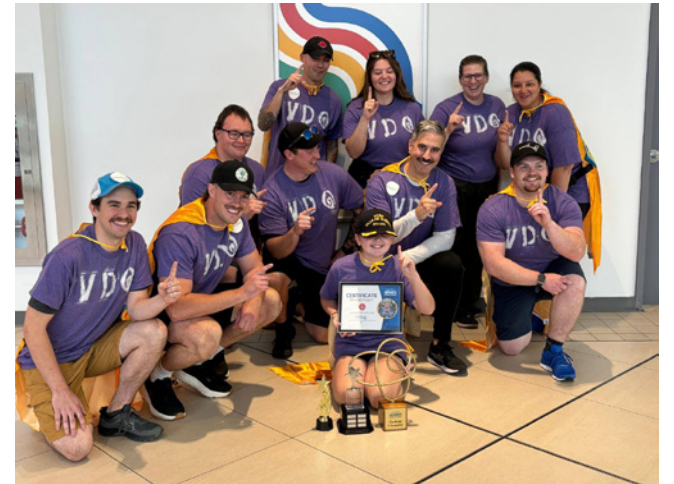
L'équipe du « Défi des Héros » du NCSM Ville de Québec avec Molly, l'une des bénéficiaires locaux de rêves.

tumes de super-héros et ont fait équipe avec Molly, ancienne bénéficiaire d'un rêve, pour le « Défi des héros », une journée d'activités amusantes de renforcement de l'esprit d'équipe au Mic Mac Mall. Chaque équipe a été jumelée à un bénéficiaire de rêve local en tant que « capitaine » et chargée de recueillir 10 000 $ (le coût symbolique d'un rêve) en prévision de la journée.