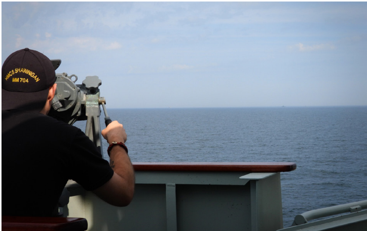
A Russian submarine is monitored by the crew of HMCS Shawinigan , as it transits through the Baltic Sea, on August 29.