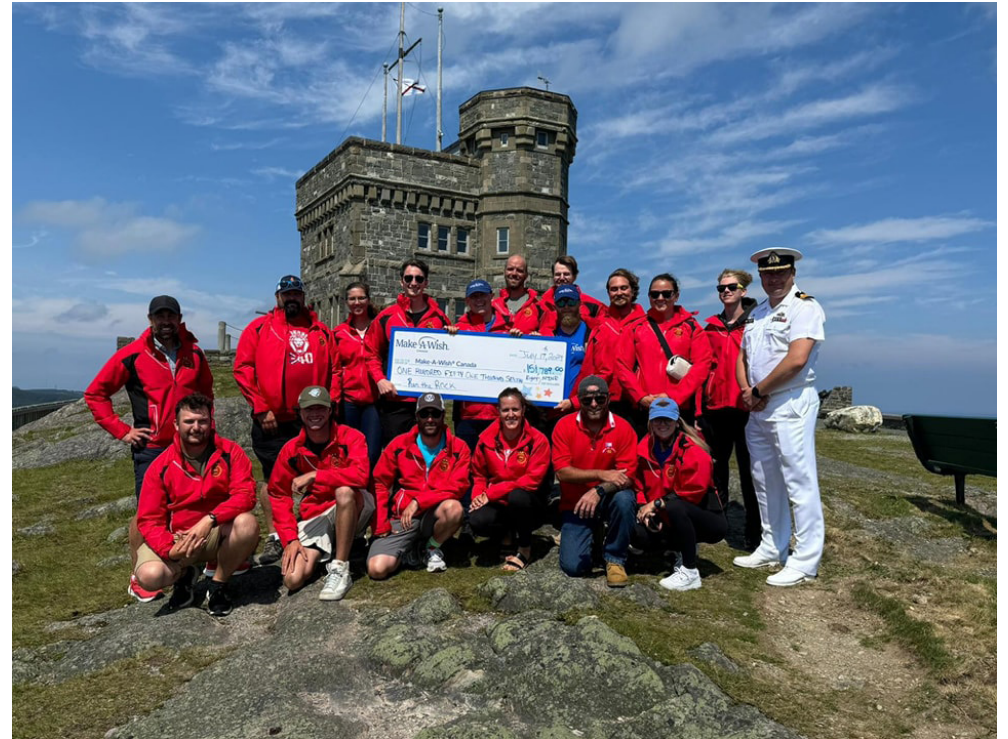
The 2024 Run the Rock team from HMCS St. John's .