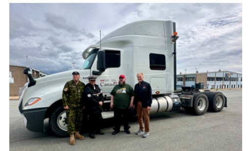
Les membres du Log B de la BFC Halifax étaient sur place pour appuyer le convoi de camions Big Rigs, Big Hearts, Big Results au profit des Jeux Olympiques spéciaux de la Nouvelle-Écosse le 21 septembre.

En réfléchissant à l'activité de 2024, les dirigeants et les bénévoles du Service de la Log B sont reconnaissants d'avoir eu l'occasion de contribuer et ont hâte d'apporter leur soutien à nouveau aux Jeux Olympiques spéciaux de Nouvelle-Écosse l'an prochain. Selon eux, le convoi a non seulement permis de mettre en évidence la camaraderie entre les différents secteurs de la communauté, mais il a également témoigné du soutien indéfectible offert aux athlètes qui s'efforcent de réaliser leurs rêves.