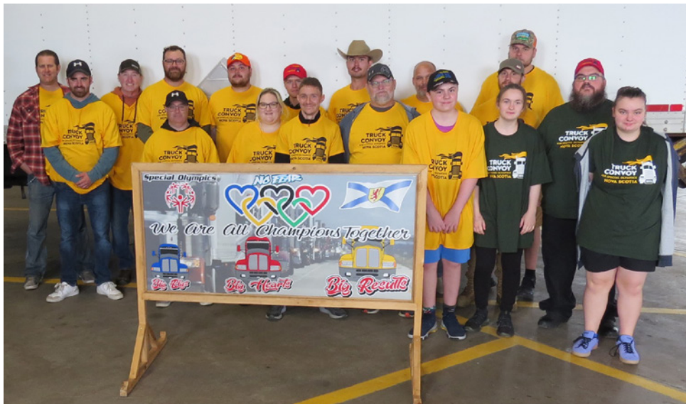
Members of CFB Halifax BLog were on hand to support the Big Rigs, Big Hearts, Big Results Truck Convoy in support of Special Olympics Nova Scotia on September 21.

In reflecting on the 2024 event, BLog leadership and volunteers were grateful for the chance to contribute and are looking forward to supporting Special Olympics Nova Scotia again next year. They felt the convoy not only showcased the camaraderie among different sectors of the community but was also a testament to the unwavering support for athletes striving to achieve their dreams.