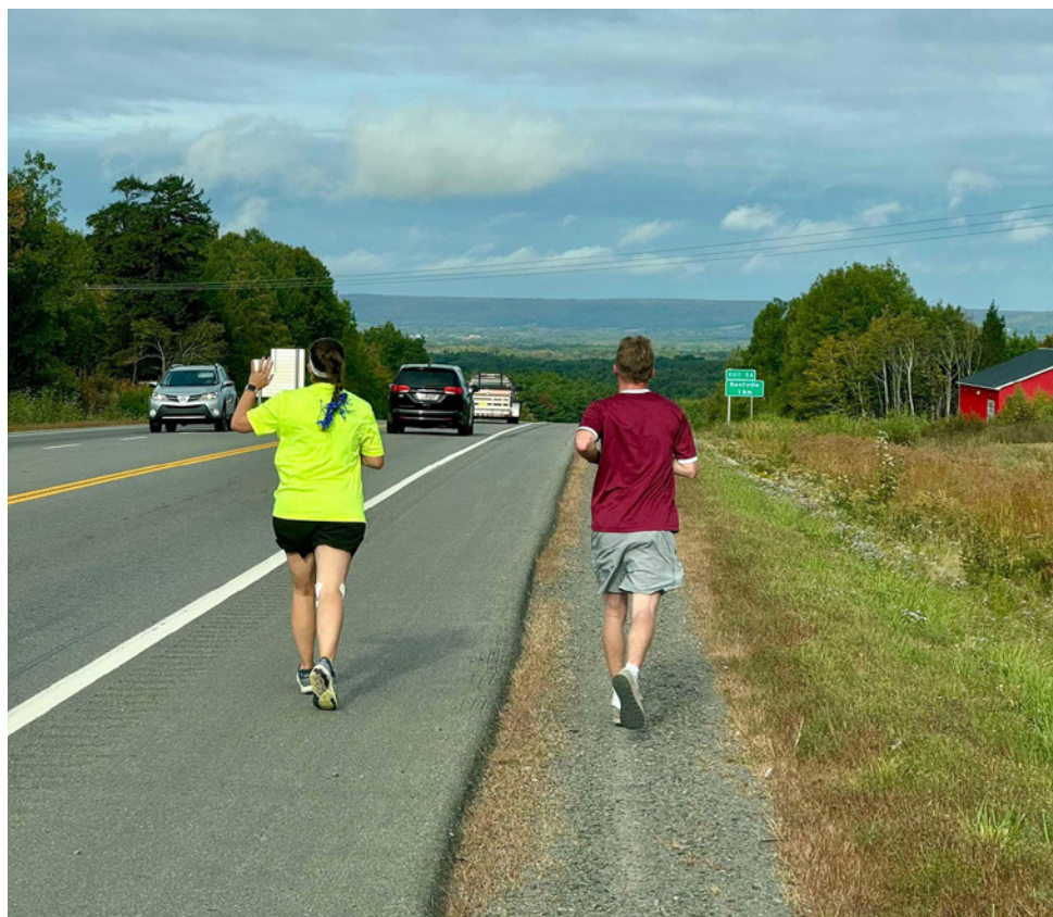
Runners from HMCS Halifax make their way through the Kentville area during this year's campaign.

The team from HMCS Fredericton switched things up for their annual fundraiser earlier this summer, moving away from a relay run and hopping on bicycles to make their way across New Brunswick. The Ride for Wishes campaign ran from July 27 – August 2, bringing the team from the province's northern tip in Campbellton to the grand finale and check presentation in Fredericton.