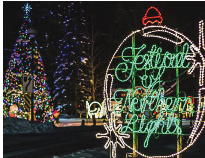
Adapté des informations disponibles sur www.owensound.ca

La Ville exploite deux arénas, de nombreux complexes de soccer et de baseball, et dispose d'un centre de loisirs moderne avec piscines, salles de sport et plus encore.