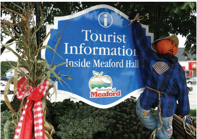
Adapté des informations disponibles sur www.meaford.ca

21 Trowbridge St. W Meaford, ON N4L 1A1 519-538-1060 www.meaford.ca