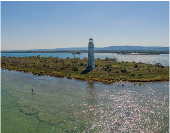
Adapté des informations disponibles sur www.collingwood.ca

Pour une liste complète des festivals et événements à Collingwood, consultez : collingwood.ca/culture-recreation-events/festivals-events