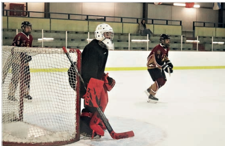
Constamment à l'affût, le cerbère de l'équipe du 5 e Régiment du génie de combat-5 e Bataillon des services a maintenu une inébranlable concentration pendant la première période de jeu, le 7 avril.