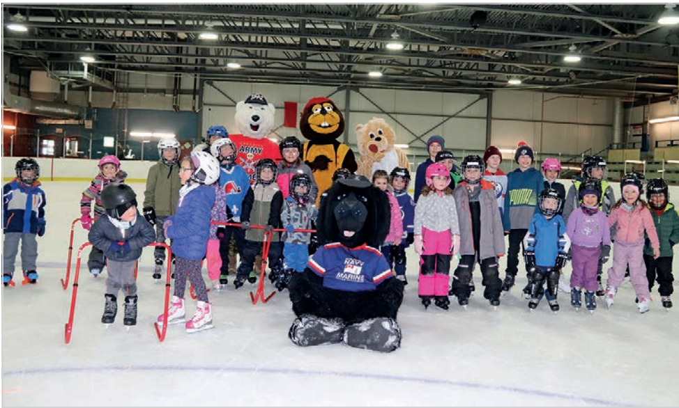
Difficile de prendre une photo de groupe avec des petits patineurs qui ont la bougeotte. Les mascottes, elles, prennent la pose et une pause....