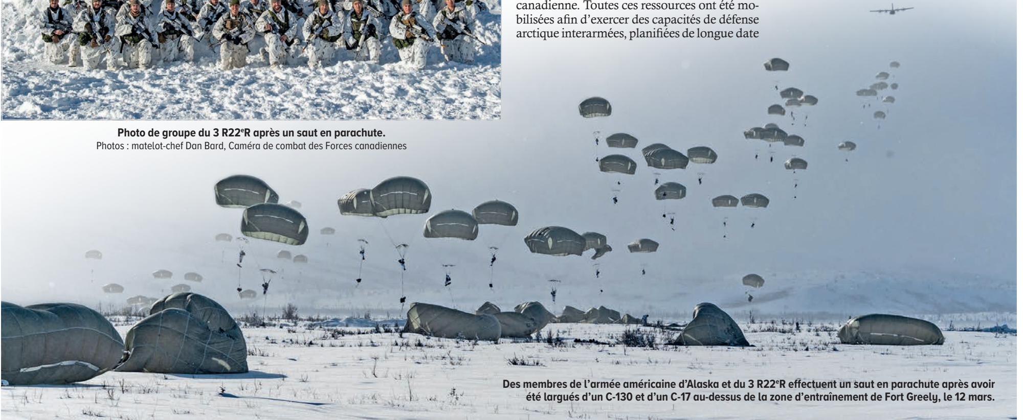
Des membres de l'armée américaine d'Alaska et du 3 R22 e R effectuent un saut en parachute après avoir été largués d'un C-130 et d'un C-17 au-dessus de la zone d'entraînement de Fort Greely, le 12 mars.

La priorité du Canada est de s'assurer que l'Arctique soit une zone de coopération mondiale et de veiller à ce que l'ordre international fondé sur des règles soit préservé. Voici en images un aperçu de l'expérience vécue par les membres du 3 R22 e R en Alaska.