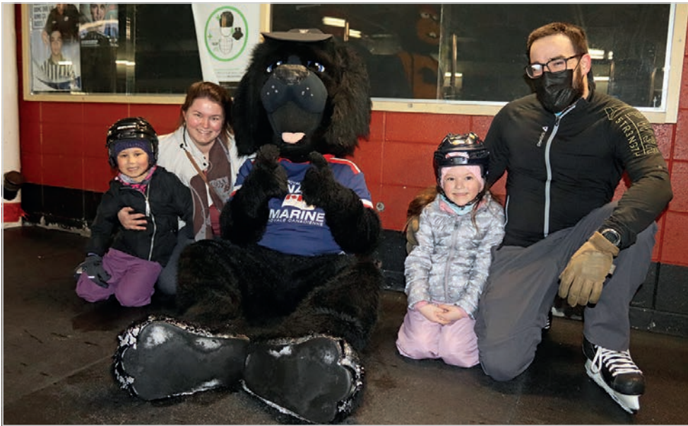
Une photo de famille avec une mascotte fait toujours sourire.