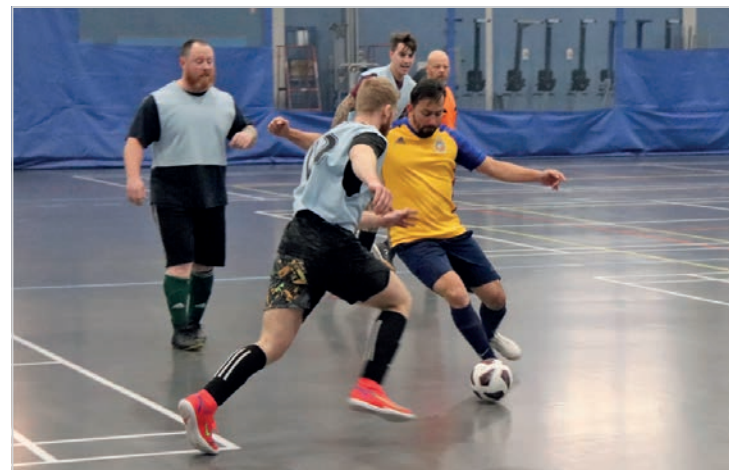
Tactiques, feintes et rythme de jeu endiablé étaient au rendez-vous lors des récentes séries de soccer intérieur se déroulant au Centre des sports de la Base Valcartier en avril.