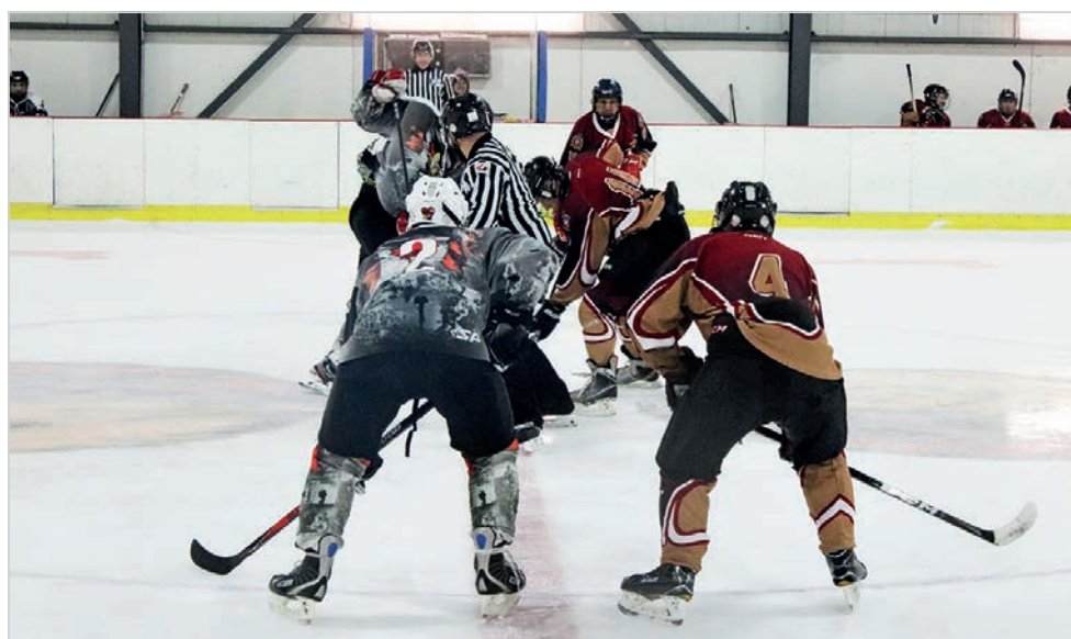
Les joueurs du 1 er Bataillon, Royal 22 e Régiment (à gauche) affrontaient l'équipe formée de membres du 5 e Régiment du génie de combat et du 5 e Bataillon des services, le 7 avril, à l'aréna Clément-Boulanger.

L'Université d'Ottawa diffuse un sondage concernant la reprise des sports militaires. En remplissant ce questionnaire, vous aurez l'occasion d'influencer directement l'orientation du Programme des sports des Forces armées canadiennes. Les personnes intéressées à participer au sondage peuvent le faire sur le site https://uottawatelfer.ca1.qualtrics.com/jfe/form/SV_0kzs66Y10GXrfjU jusqu'au 18 avril.