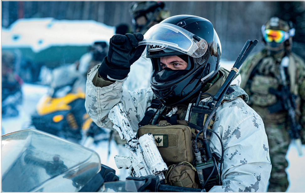
Bientôt prêt à s'élancer en motoneige dans la zone d'entraînement de Fort Greely.