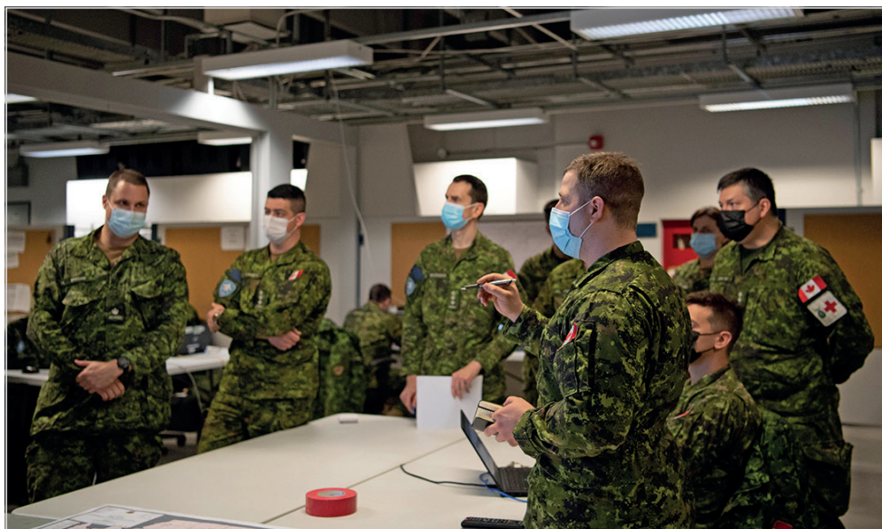
L'équipe des plans du commandement de la composante terrestre (CCT) travaille sur le développement d'un plan pour les groupes-bataillons territoriaux à la suite de la réception d'un ordre fragmentaire de la FOI (Est).

Bien que cet exercice se tienne de façon annuelle (hors COVID), une partie de ses objectifs étaient différents cette année. Au lieu de servir de validation pour les postes de commandement des groupes-bataillons territoriaux (GBT), il a plutôt servi à entraîner un commandement de la composante terrestre (CCT) de la Réserve pour servir d'alternative potentielle au CCT habituellement fourni par le 5 e Groupe-brigade mécanisé du Canada. En parlant aux participants de l'exercice, le brigadier-général Stéphane Boivin, commandant de la 2 Div CA/FOI (Est), a dit : «Vous avez démontré que c'est possible qu'un quartier général, composé des deux brigades de la