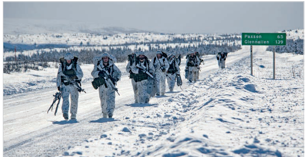
Après leur saut en parachute, une marche en direction du point de ralliement.

L'objectif poursuivi par l'exercice JPMRC était de renforcer les lignes de communication entre les unités américaines de l'Alaska et les Forces armées canadiennes (FAC). L'atteinte de cet objectif passe par le développement de relations solides entre les deux pays et de la capacité à mener conjointement des opérations par temps froid. L'exercice avait