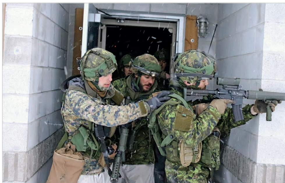
À l'image d'une situation de combat en zone urbaine réelle, chaque frère d'armes du 3 R22 e R avait la responsabilité de couvrir les arrières de ses collègues.

«Certains de nos jeunes soldats ont l'occasion pour la première fois de dormir plusieurs nuits dans les tentes arctiques et d'opérer une base de patrouille en gardant les yeux sur leur