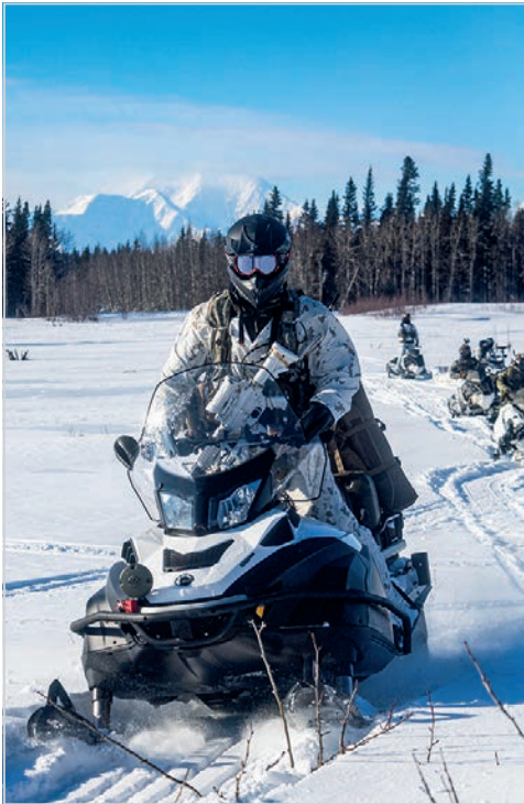
Patrouille de reconnaissance avec des membres des Forces spéciales des États-Unis le 12 mars.