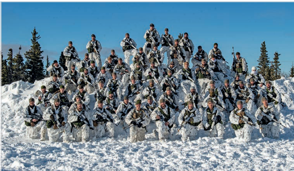
Photo de groupe du 3 R22 e R après un saut en parachute.