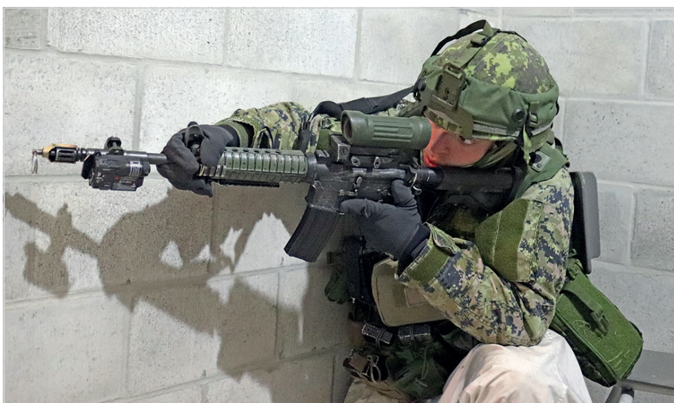
Les participants à l'exercice SPARTIATE KRUPTO ont fait preuve d'une grande concentration afin de mettre en échec les plans malveillants d'une force ennemie (simulée).

Après l'exercice SPARTIATE KRUPTO, les membres du 3 R22 e R participeront à un exercice bilatéral avec leurs homologues américains en Louisiane. «Il s'agit d'un exercice de grande envergure qui nécessite beaucoup de préparation. Nous entreprenons actuellement un cycle de montée en puissance qui atteindra le niveau de bataillon», explique le Maj Houle.