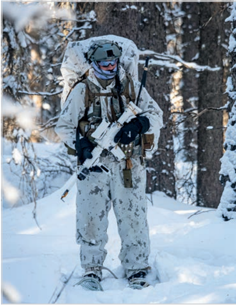
Dans le bois en raquettes, cela rappellerait un peu la maison si ce n'était de la présence de membres des Forces spéciales des États-Unis.