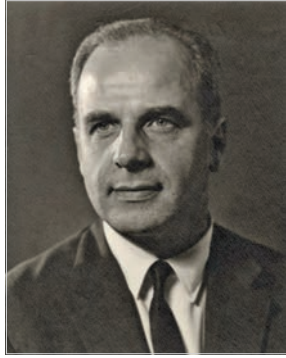
Gaylord Nelson a instauré le Jour de la Terre le 22 avril 1970. / Gaylor Nelson established Earth Day on April 22 1970.

Maintenant, connaissez-vous la théorie des 21 jours? Selon ce concept, un délai de 21 jours consécutifs est nécessaire pour qu'une habitude devienne un automatisme chez l'humain. Des livres portant des titres comme «21 jours pour arrêter de fumer», «21 jours pour quitter la vie sédentaire» et «21 jours pour mincir» ont ainsi connu une immense popularité chez les gourous du bonheur. En contrepartie, une étude européenne indique