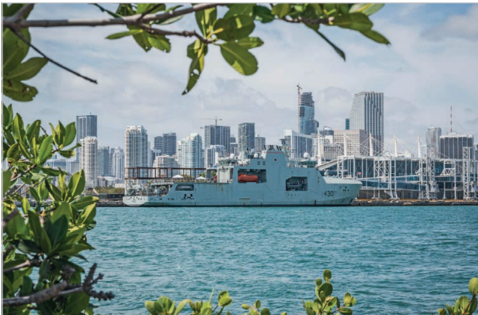
Le NCSM Harry DeWolf mise sur une manœuvrabilité exemplaire, une grande polyvalence et une gamme complète de technologies de pointe afin d'atteindre l'ensemble de ses objectifs. Sur cette photo, il était amarré au port de Miami, le 9 mai.

Au cours des dernières semaines, le NCSM Harry DeWolf , en appui au détachement d'application de la loi de la Garde côtière des