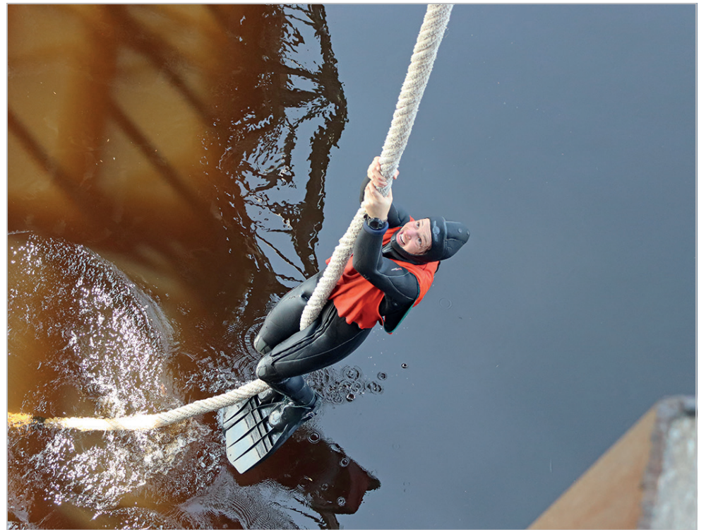
Les participants ont relevé une série d'épreuves nécessitant concentration, force, agilité et cohésion d'équipe.

L'Adsum a visité les aspirants plongeurs de combat de la sélection lors de l'avant-dernière journée de celle-ci. Seulement cinq valeu-