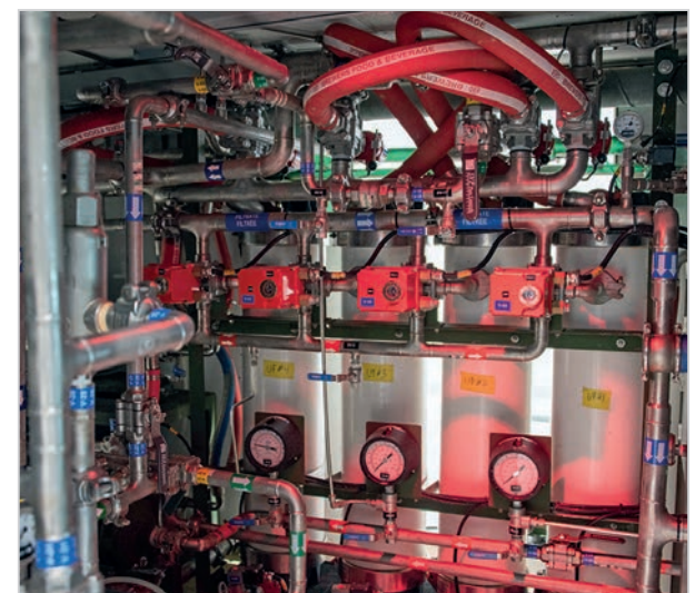
Seules quelques bases et garnisons à travers le Canada possèdent un SPEOI comme celui du 5 RGC.

«Le système dispose d'un écran central interactif nous permettant de suivre avec précision toutes les étapes de purification. Le SPEOI