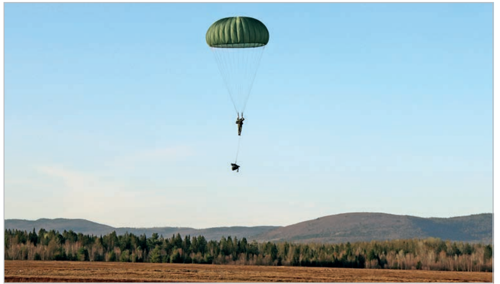
Les candidats ont complété un total de cinq sauts dans les secteurs d'entraînement de la Base Valcartier, dont un de nuit.