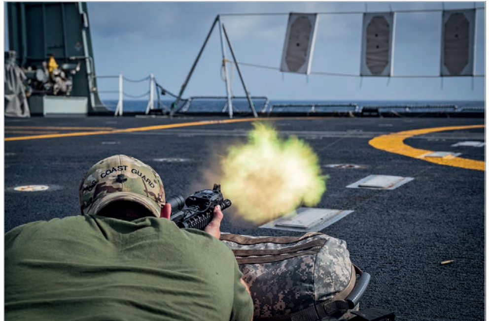
Un membre du détachement d'application de la loi de la garde côtière américaine tire sur des cibles.