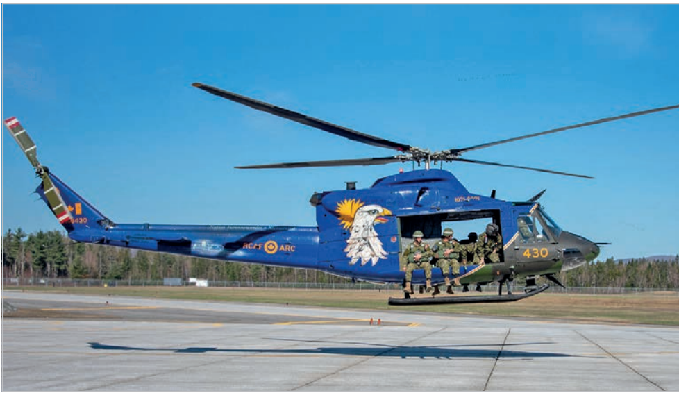
Les apprentis parachutistes ont eu la chance de réaliser des sauts à partir de l'hélicoptère spécialement peint afin de célébrer le cinquantième anniversaire de l'affiliation entre le 430 e Escadron tactique d'hélicoptères et le 5 GBMC.