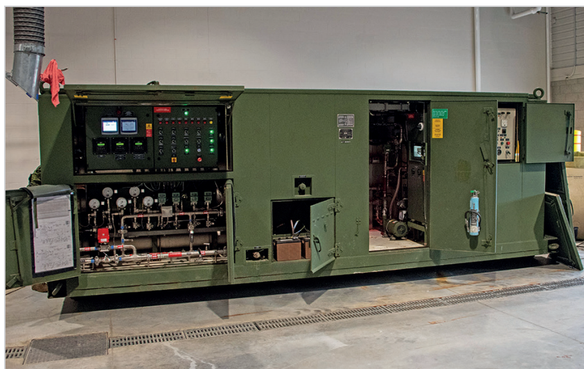
Le révolutionnaire SPEOI est entretenu quotidiennement avec soin par les spécialistes du 5 RGC.

Le système mise sur l'osmose inverse pour accomplir ses petits miracles de purification de l'eau. En résumé, il s'agit d'un procédé de séparation par pression. Le SPEOI contient des récipients sous pression munis de modules de membrane d'osmose inverse.