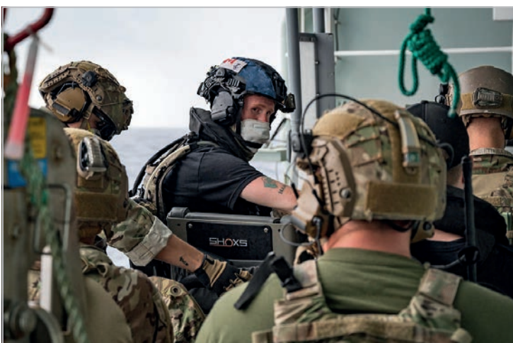
Des membres de la Marine royale canadienne et leurs alliés américains s'exercent à procéder à l'arraisonnement de navires.