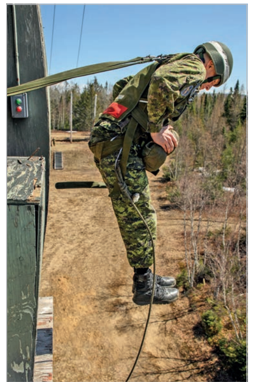
Avant d'effectuer des sauts réels, les candidats ont d'abord dû réussir leurs évaluations sur la tour de simulation de l'aéronef de la Base Valcartier.

La qualification de parachutiste de base donne accès à des formations spécialisées