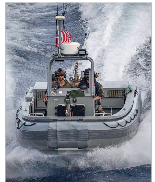
Un membre de la MRC conduit l'embarcation de sauvetage polyvalente du NCSM Harry DeWolf avec à son bord des membres du détachement d'application de la loi de la garde côtière américaine.

Le navire est équipé de radars de recherche de surface et de capteurs à la pointe de la technologie, d'une puissante mitrailleuse MK38 télécommandée de 25 mm incluant un canon M242, ainsi que d'un système de ciblage et de surveillance très précis.