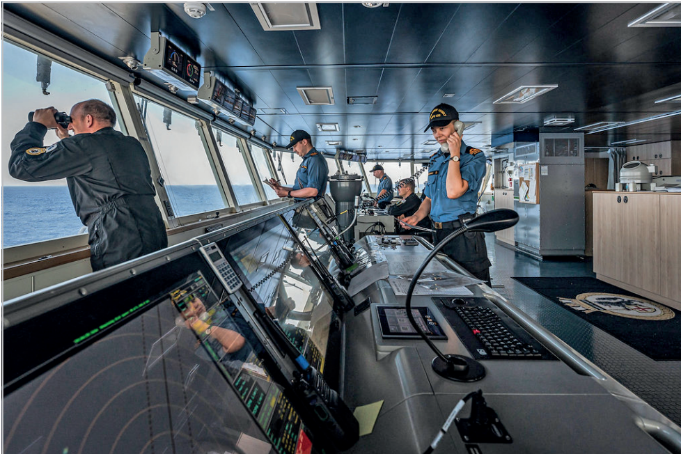
Des membres d'équipage s'acquittent de leurs fonctions sur la passerelle du NCSM Harry DeWolf au cours de l'opération CARIBBE, dans l'océan Atlantique, le 3 mai.