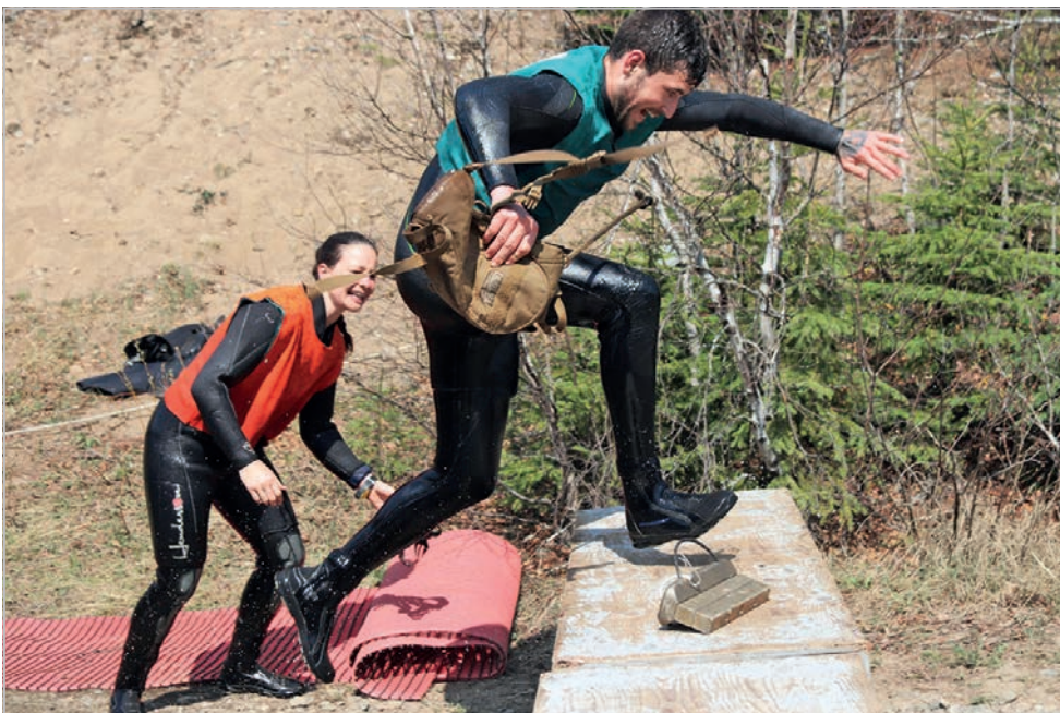
On pouvait voir la détermination sur le visage des quelques candidats toujours en lice dans le cadre de la sélection du cours de plongeur de combat se déroulant en mai, dans les secteurs d'entraînement de la Base Valcartier.

reux candidats étaient à ce moment toujours en lice. Sous la supervision de leurs instructeurs, les participants étaient invités à sauter les pieds dans le vide à partir de l'un des piliers centraux du pont Cadieux. Cette chute de plusieurs mètres simulait le largage aéroporté d'un plongeur de combat dans un lac. Après l'entrée dans l'eau, les participants devaient lutter contre le courant de la rivière pour s'agripper et ensuite se hisser jusqu'au sommet d'une corde accrochée au pont.