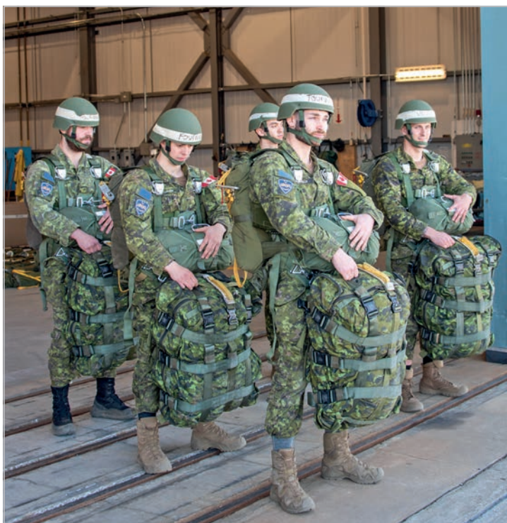
Une solide cohésion d'équipe s'est rapidement formée au sein du groupe de candidats du cours de parachutisme de base.

Ils ont fait preuve de détermination pour soutenir un horaire chargé et une course d'apprentissage qui s'intensifiait chaque jour. La cohésion AIRBORNE s'est formée en quelques jours entre tous les participants. À la fin de