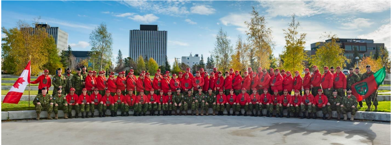
Rangers canadiens à Yellowknife, NT pendant la formation au leadership en octobre 2019

Le rôle joué par les RC et le personnel du 1 GPRC est essentiel pour assurer une présence des Forces armées canadiennes (FAC) dans le Nord. Notre devise « Vigilans » se traduit par « Les gardiens ».