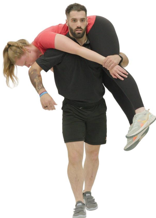
Figure 4.3 Transport d'une victime sur l'épaule sur 100m – Position de transport