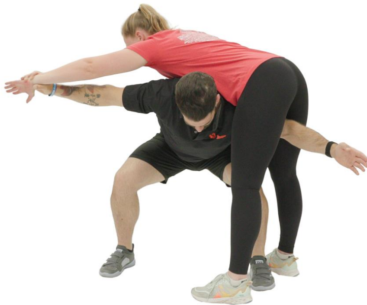
Figure 4.1 Transport d'une victime sur l'épaule sur 100m – Position de départ