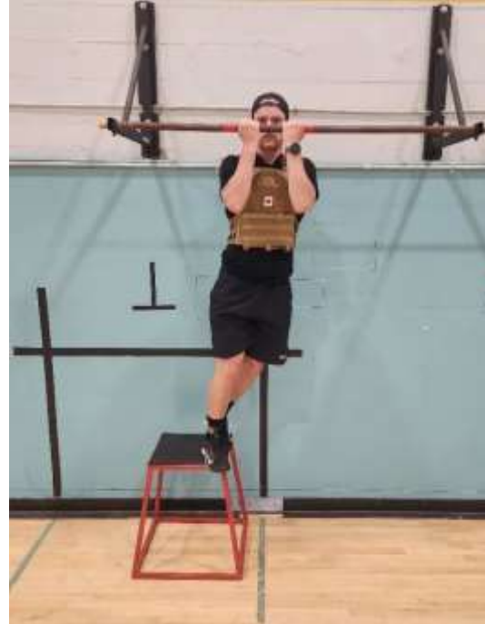
Figure 4.1 Installation et positions de départ appropriées