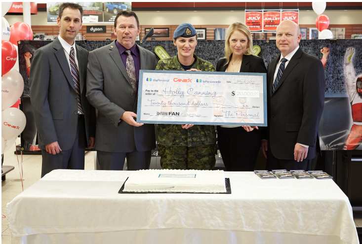
Gagnante du concours L'ultime mordu de sport de 2012 de CANEX et La Personnelle

Quelque 93 600 membres de la Force régulière et de la réserve sont couverts par le régime d'assurance invalidité prolongée (AIP) des SF RARM. En tout, les prestations et le soutien fournis dans le cadre de l'AIP et du programme de réadaptation professionnelle (PRP) se sont élevées à 106,6 M$. Des prestations d'AIP ont été versées à 5 038 anciens combattants, et 3 217 vétérans ont reçu l'assistance du PRP.