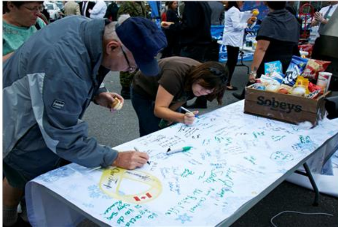
Operation Santa Claus

Residents from Orleans, Ontario, sign a Support Our Troop banner at the 2012 Sobeys Orleans BBQ Operation Santa Claus, a donation drive and send off.