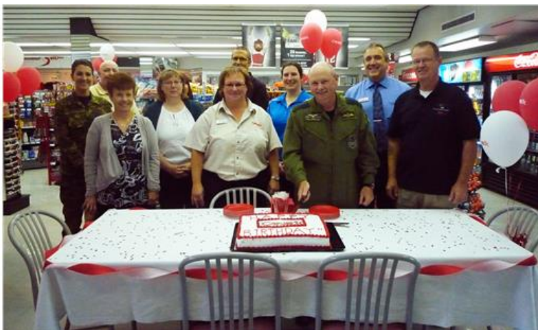
CANEX fête ses 44 ans

En septembre 2012, les clients d'un océan à l'autre ont fêté les 44 ans de CANEX et profité des rabais offerts en magasin. La communauté militaire de Moose Jaw a pris part aux festivités, et le commandant de l'escadre était