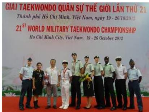
Championnats mondiaux de taekwondo du CISM 2012 – Ho Chi Minh, Vietnam