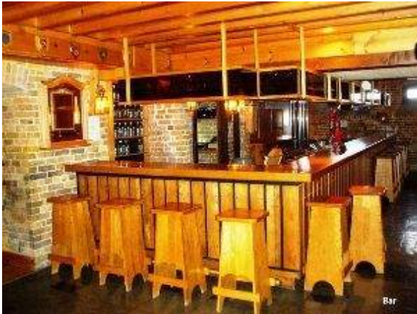
Bar principal au mess des officiers à La Citadelle de Québec

Plus de 200 mess de la Force régulière et de la Force de réserve ont reçu des fonds des BNP pour financer des activités de divertissement, l'exploitation de bars et la tenue d'activités spéciales.