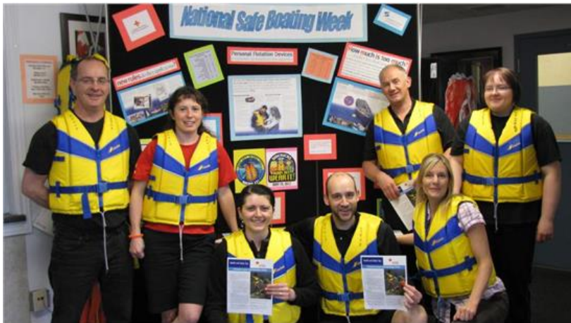
Le personnel des PSP à Gander célèbre en grand la Journée nationale des gilets de sauvetage

En mai 2012, vêtus de leurs gilets aux couleurs vives, les membres du personnel des PSP ont arrêté la circulation pour distribuer de l'information sur les gilets de sauvetage et la sécurité nautique en vue de la Semaine nationale de la sécurité nautique.