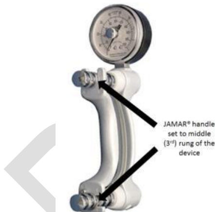
Figure XX : dynamomètre JAMAR et poignée de préhension