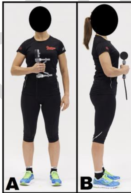
Figure XX : plan frontal (A) et sagittal (B) de la position du corps et du dynamomètre JAMAR® pour la mesure de la force de préhension